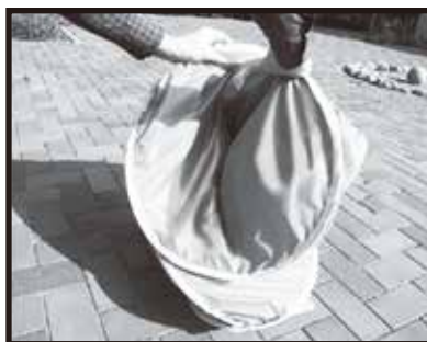
5. 右側を左側の下にすべり込ませます