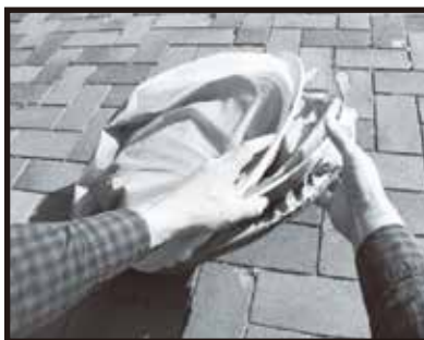
8. 3つの輪のサイズが同じになるよう調整し、枠の外に出ている布部分を内側に入れます