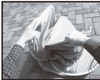
6. 右側と左側が重なってきたら、無理な力を加えなくても自然に手前に閉じてきます