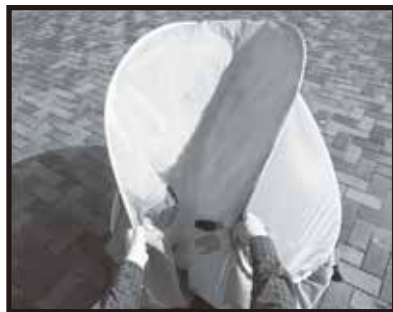
1. テント底面から両サイドを握ります