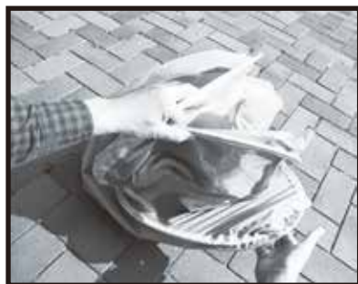
7. 3つの輪ができます