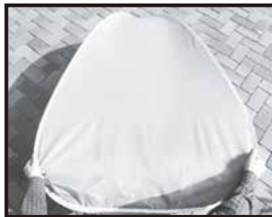
3. 重ね合わせた両端の下方を握ります