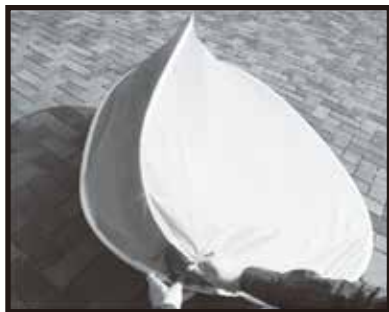
2. そのまま端を重ね合わせます