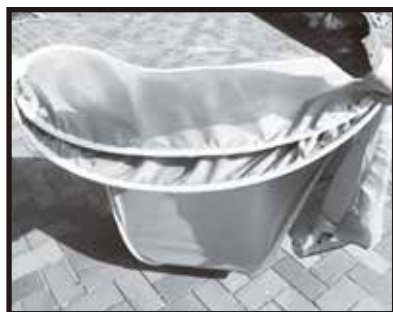
4. テント上部を地面に押し当てながら、手首を使って内側に回し込みます