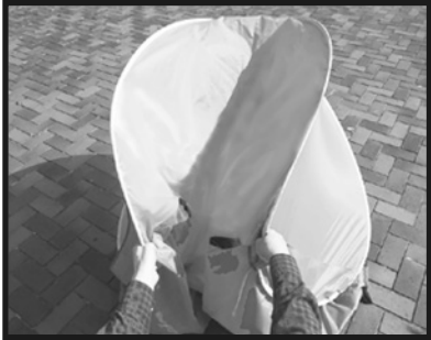
1. テント底面から両サイドを握ります