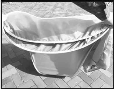
4. テント上部を地面に押し当てながら、手首を使って内側に回し込みます