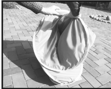
5. 右側を左側の下にすべり込ませます