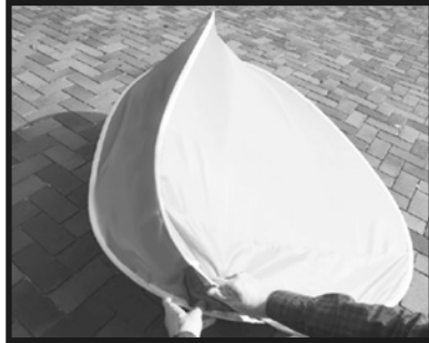
2. そのまま端を重ね合わせます