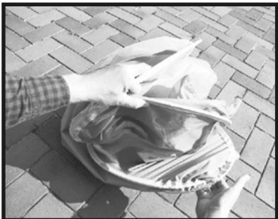
7. 3つの輪ができます