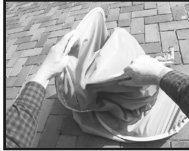
6. 右側と左側が重なってきたら、無理な力を加えなくても自然に手前に閉じてきます