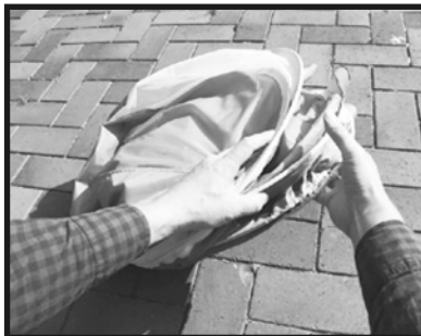
8. 3つの輪のサイズが同じになるよう調整し、枠の外に出ている布部分を内側に入れます