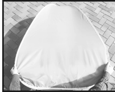
3. 重ね合わせた両端の下方を握ります